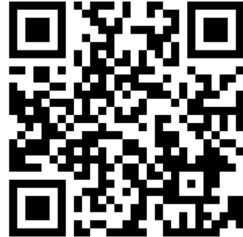
Website QR Code for web input