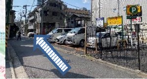
⑪パーキングのところの間の道を公園に向かって直進。