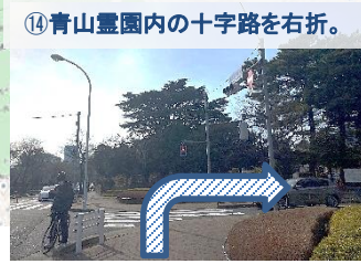
⑭青山霊園内の十字路を右折。