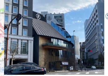
⑨ 豊川稲荷東京別院前を通った後、目の前にとらやが見える信号を渡り、右に進みます。