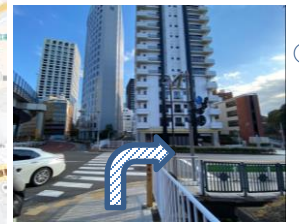
⑦ 紀伊國坂の目印を見つけたら目の前の歩道を渡り右折します。