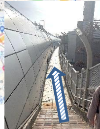
⑬TOTOのビルを右折後、道を進むとつきあたる左右の細い道(どちらでもOK)を下り青山霊園に向かいます。