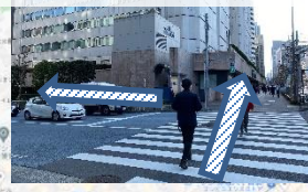
⑩郵便局前の信号を渡り左折