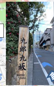
⑧ 九郎九坂をまっすぐ進むと右手に豊川稲荷東京別院があります。この角を右折です。